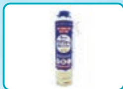
アクアフォーム® 1液性 ハンドタイプ あらゆる断熱施工の補助製品