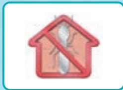
アクアフォーム®NEO+TP 防蟻処理済みアクアフォーム®