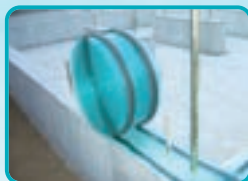
アクアパッキン 木造戸建基礎用気密パッキン