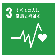
3 すべての人に健康と福祉を

日本アクアは、「人と地球に優しい住環境を創ることで社会に貢献」という経営理念のもと、国連が提唱する持続可能な開発目標「SDGs (Sustainable Development Goals)」に貢献します。アクアフォーム®は、住む人の健康・快適な暮らしを先ず最優先に担保したうえで、住宅が排出するCO 2 を削減し、地球に優しい省エネルギー住宅を創ります。