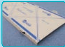
アクエアシリーズ 屋根用通気・遮熱