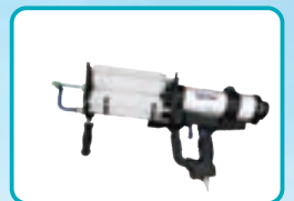
アクアショット 簡易型2液混合スプレーシステム