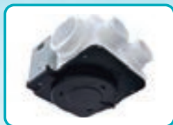
換気システム 排気型集中換気システム