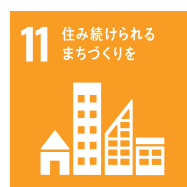
11 住み続けられるまちづくりを