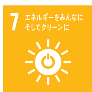
7 エネルギーをみんなにそしてクリーンに