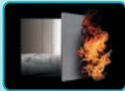
アクアモエン NEO® 断熱用吹付け硬質ウレタンフォーム