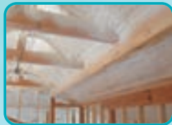
アクアフォーム® 木造戸建の高気密断熱材