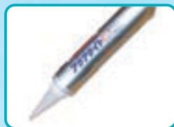
アクアタイトシリーズ 床根太・床仕上げ接着剤