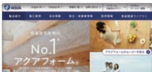
アクアフォーム® 紹介ページ

日本アクアを支える「アクアフォーム®」は、温室効果の大きいフロンガスを使わず、水を使って現場で発泡させる断熱材です。