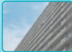
アクアAフォーム 環境性能に優れた汎用タイプ