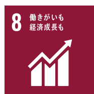
8 働きがいも経済成長も