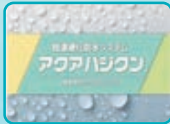
アクアハジクン® 建築物吹付け防水システム