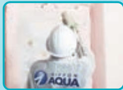
アクアフォーム®NEO 環境性能と熱伝導率を両立